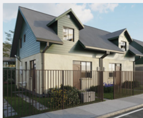
FILADELFIA 76 m 2