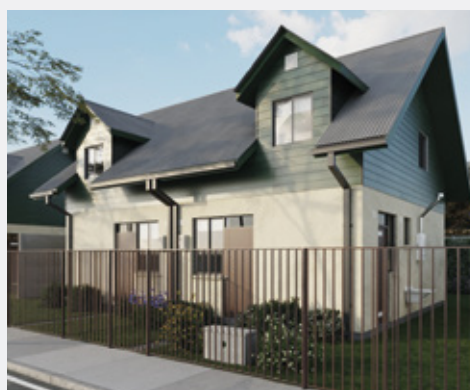
SEÚL 66 m 2