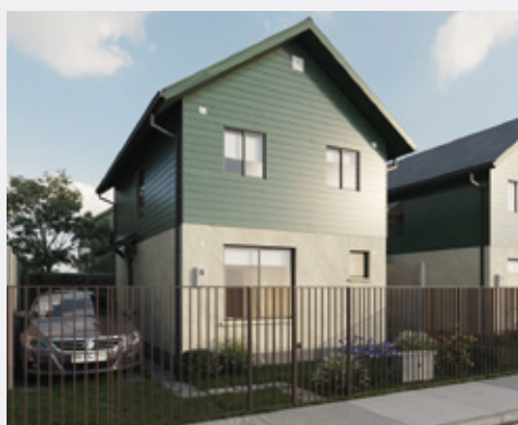
ATENAS 86 m 2