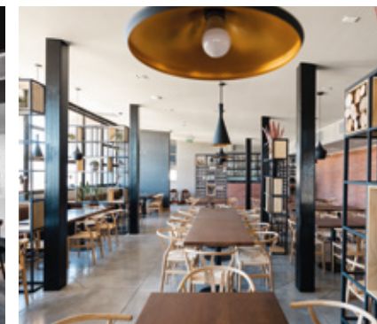
Restaurante La Hacienda