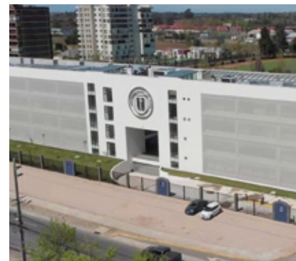
Universidad Católica del Maule